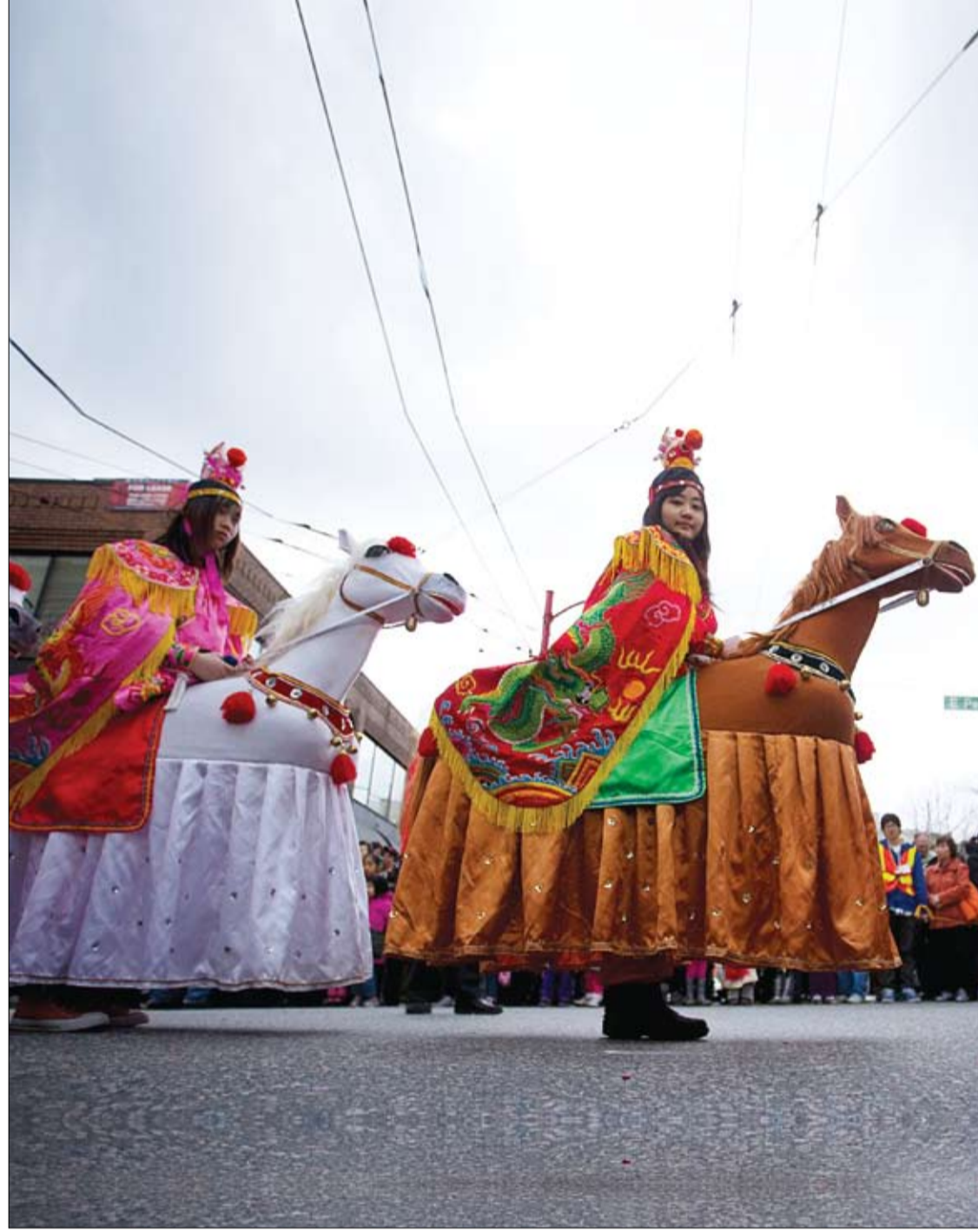
فتيات تؤدين عرضاً بأزياء على هيئة خيول تسير في الشوارع أثناء احتفالات رأس السنة الصينية في كولومبيا البريطانية.

وكشفت أوبرمايستر أنه عادة ما يستخدم الطبيب نوعيات معينة من الأزاميل والمبارد لتعديل شكل عظام الأنف وغضاريفها بعد تخدير المريض، لافتة إلى أنه قد يقوم الجراح في كثير من الحالات بإجراء الجراحة عبر فتحتي الأنف لتجنب ظهور ندبات خارجية بعد ذلك.